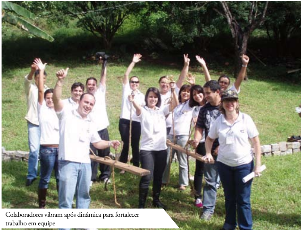
Colaboradores vibram após dinâmica para fortalecer trabalho em equipe

Visando o desenvolvimento dos seus líderes, o Grupo Santa Casa iniciou treinamento com foco no trabalho em equipe, atendimento humanizado ao cliente interno e relacionamento interpessoal. A primeira capacitação das lideranças ocorreu de 1º a 3 de dezembro, em São Sebastião das Águas Claras (Macacos), onde foram treinados cerca de 75 gerentes, coordenadores e supervisores.