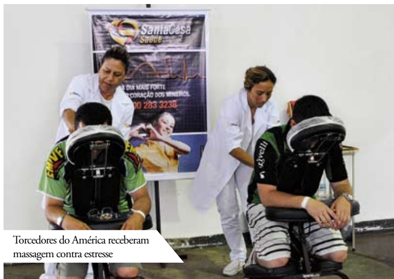
Torcedores do América receberam massagem contra estresse

Com o patrocínio do Santa Casa Saúde, que garante assistência em saúde aos seus atletas, América e Mackenzie foram o destaque deste ano no vôlei feminino e no