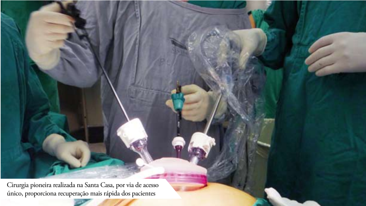
Cirurgia pioneira realizada na Santa Casa, por via de acesso único, proporciona recuperação mais rápida dos pacientes

A aplicação do acesso laparoscópico para os procedimentos colorretais representa um grande avanço no sentido de proporcionar recuperação mais rápida dos pacientes. Os materiais utilizados nestes procedimentos e o tempo operatório estão associados a custos mais elevados. No entanto, o acúmulo de experiência do cirurgião, associado à diminuição de tempo operatório, à tendência natural de redução de preço dos materiais na medida em que surgem tecnologias mais avançadas e ao emprego de medidas