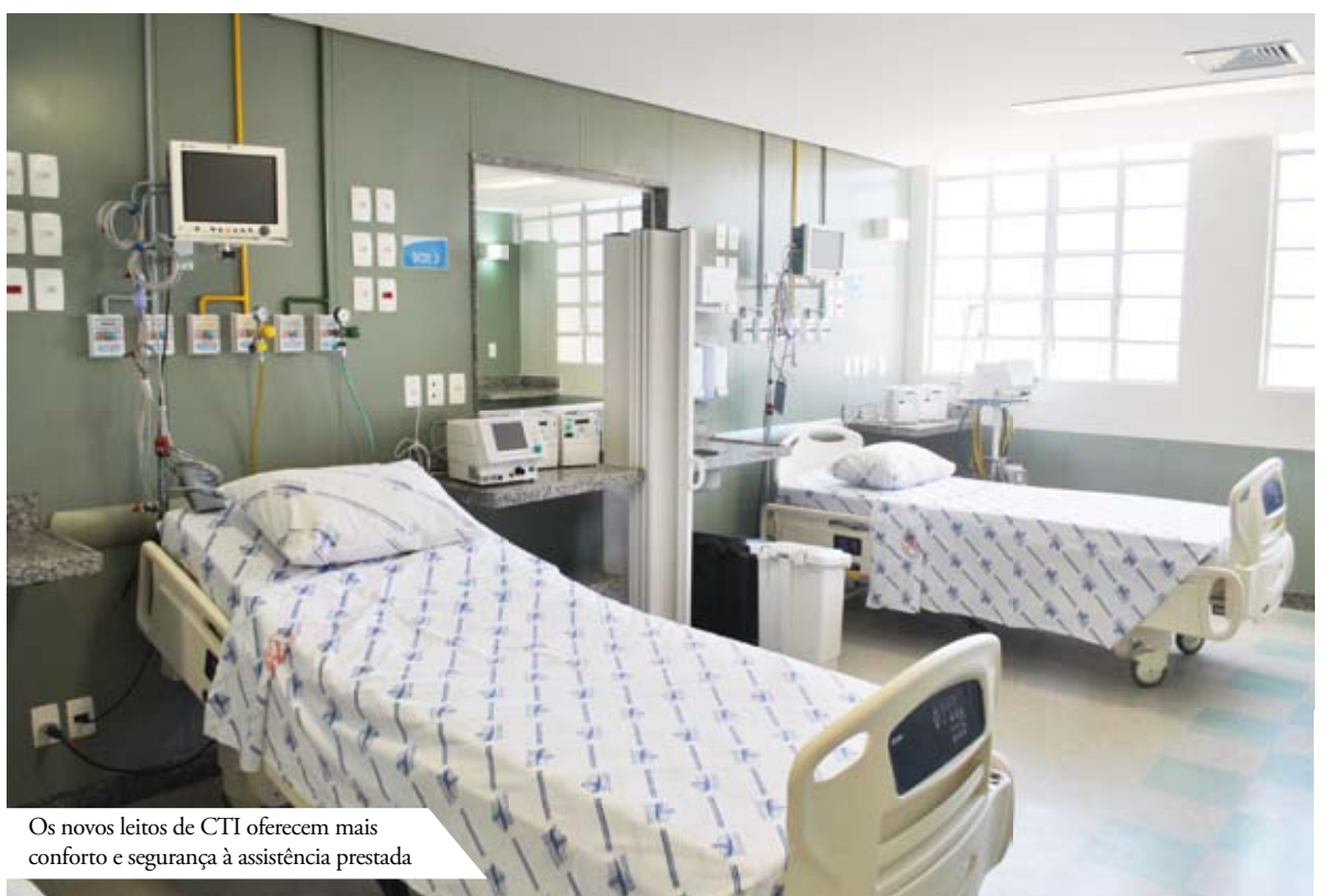
Os novos leitos de CTI oferecem mais conforto e segurança à assistência prestada