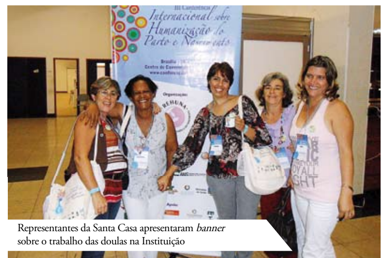
Representantes da Santa Casa apresentaram banner sobre o trabalho das doulas na Instituição

da participação do companheiro nestes momentos, pois ele pode identificar uma doença que afetará diretamente a saúde do bebê e da mãe. O pré-natal, visto desta forma, é uma ótima oportunidade para o companheiro também ficar atento com a sua saúde”, alerta a assistente social.