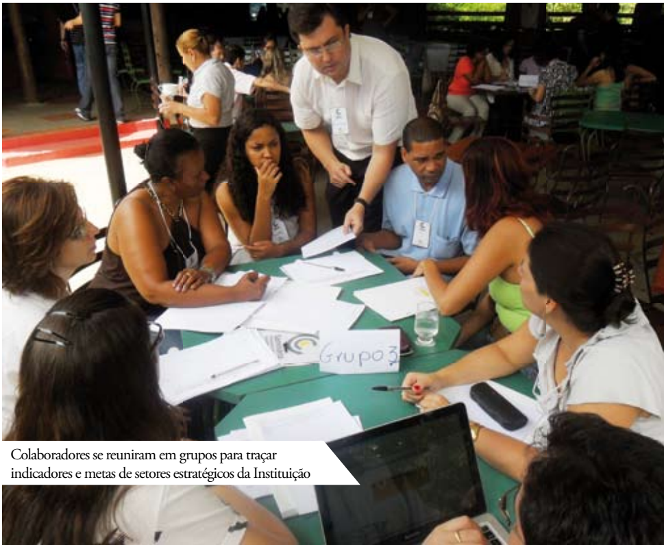
Colaboradores se reuniram em grupos para traçar indicadores e metas de setores estratégicos da Instituição

O Grupo Santa Casa promoveu, no dia 14 de dezembro, o primeiro Seminário de Planejamento Operacional de Assistência à Saúde, visando sensibilizar os profissionais estratégicos para a importância da implantação e monitoramento de indicadores hospitalares. O evento, realizado em São Sebastião das Águas Claras (Macacos), contou com a presença de cerca de 60 colaboradores, entre superintendentes, gerentes, coordenadores e supervisores.