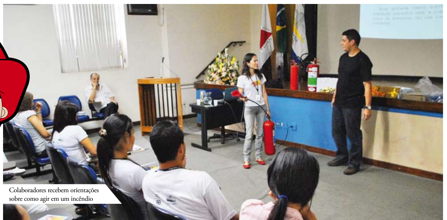
Colaboradores recebem orientações sobre como agir em um incêndio