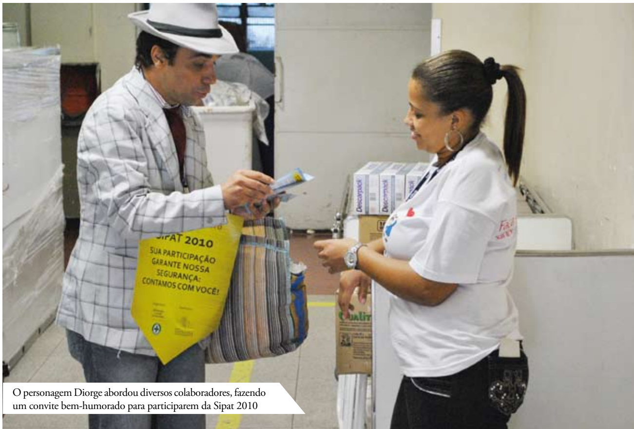
O personagem Diorge abordou diversos colaboradores, fazendo um convite bem-humorado para participarem da Sipat 2010

Com o objetivo de orientar e conscientizar os colaboradores sobre a importância da prevenção de acidentes e doenças ocupacionais, além de reciclar conhecimentos, o Grupo Santa Casa realizou, de 25 a 29 de outubro, por meio da Comissão Interna de Prevenção de Acidentes (Cipa) e da Segurança e Saúde Ocupacional (SSO), a Semana Interna de Prevenção a Acidentes do Trabalho (Sipat). Neste ano, a Sipat contemplou também os trabalhadores do período noturno, com programação especialmente elaborada e tema específico de interesse para quem trabalha à noite e/ou em turnos.