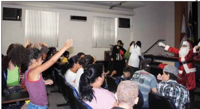
Alegria de pacientes da oncologia pediátrica na festa de natal da Quimioterapia da Santa Casa

O final de ano do Grupo Santa Casa BH foi marcado por festas e celebrações natalinas. A primeira foi a Missa de Ação de Graças da Associação das Voluntárias da Santa Casa (Avosc),