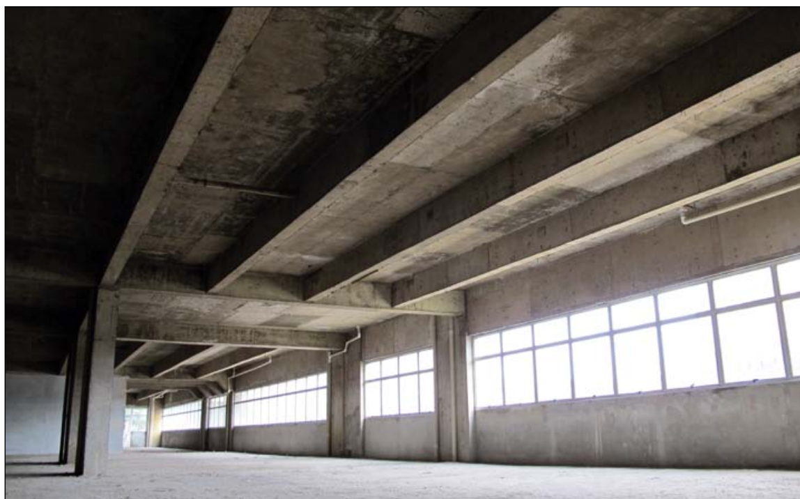
Hospital São Miguel: previsão de 18 meses para conclusão das obras

O tempo planejado para as obras de construção é de cerca de 18 meses. A previsão é de que o novo hospital entre em operação a partir do 2º semestre de 2013. Com a construção deste moderno hospital, o Grupo Santa Casa BH reafirma e fortalece sua missão de promover o bem-estar social por meio do atendimento integral e humanizado à saúde, prestando serviços de qualidade para a população de Belo Horizonte e Minas Gerais. Investindo também, hoje e sempre, em novas tecnologias, no desenvolvimento da educação e pesquisa e no aperfeiçoamento e valorização de seus profissionais.