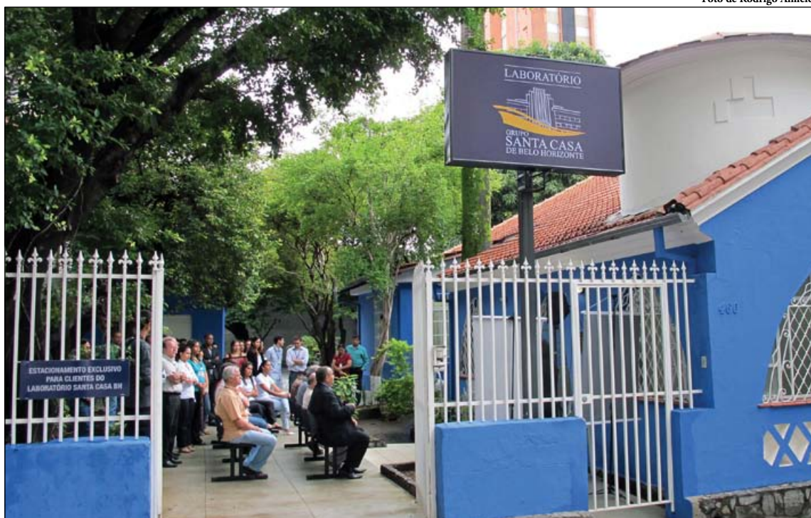
Convidados prestigiam inauguração da 1ª unidade externa do Laboratório Santa Casa BH

saúde suplementar é uma demonstração clara de que o Grupo Santa Casa está atento tanto ao paciente do Sistema Único de Saúde (SUS) quanto ao de convênios e particulares. “Momentos como este estão se tornando uma constante nos últimos anos do Grupo Santa Casa. A inauguração de hoje é uma comprovação dos investimentos feitos para ampliar e aprimorar a qualidade dos serviços prestados aos nossos pacientes do SUS e de convênios e particulares”, ressaltou.